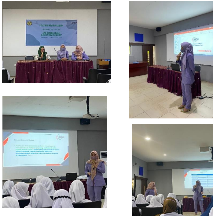
Gambar 2. Penyampaian Materi Pengabdian

Hasil kegiatan menunjukkan bahwa sebagian besar peserta mampu menyusun proposal bisnis sederhana yang mencakup deskripsi usaha, analisis pasar, strategi pemasaran, rencana operasional, kebutuhan modal, dan proyeksi keuntungan usaha. Kemampuan tersebut menunjukkan adanya peningkatan pemahaman peserta terhadap proses perencanaan bisnis yang sebelumnya belum mereka kuasai secara optimal.