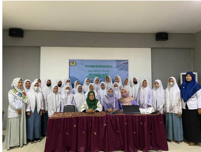
Gambar Foto Bersama Peserta dan Panitia

Secara keseluruhan, kegiatan pengabdian ini berhasil mencapai tujuan yang telah ditetapkan, yaitu meningkatkan kompetensi kewirausahaan siswa melalui pelatihan penyusunan proposal bisnis. Luaran kegiatan berupa proposal bisnis sederhana yang disusun oleh peserta menunjukkan bahwa pelatihan mampu memberikan pengalaman belajar yang aplikatif, meningkatkan keterampilan perencanaan usaha, serta menumbuhkan motivasi berwirausaha di kalangan siswa SMA Dharma Bhakti Palembang.