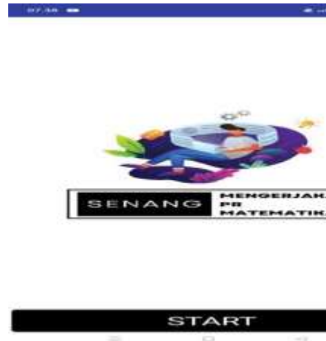
Gambar IV.2 : Tampilan Awal