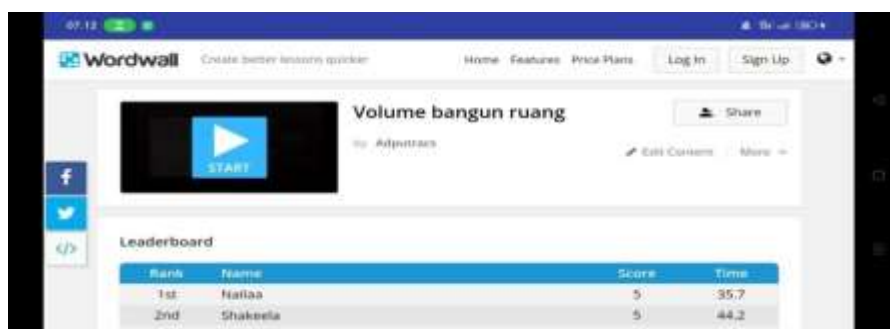
Gambar IV.6 : Tampilan Menu Game 2