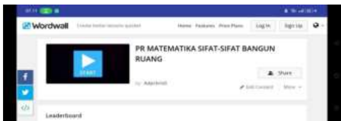
Gambar IV.5: Tampilan Game 1