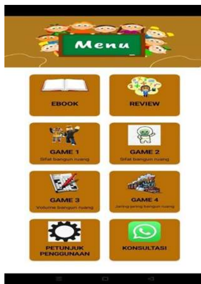
Gambar IV.3 : Menu Awal Aplikasi